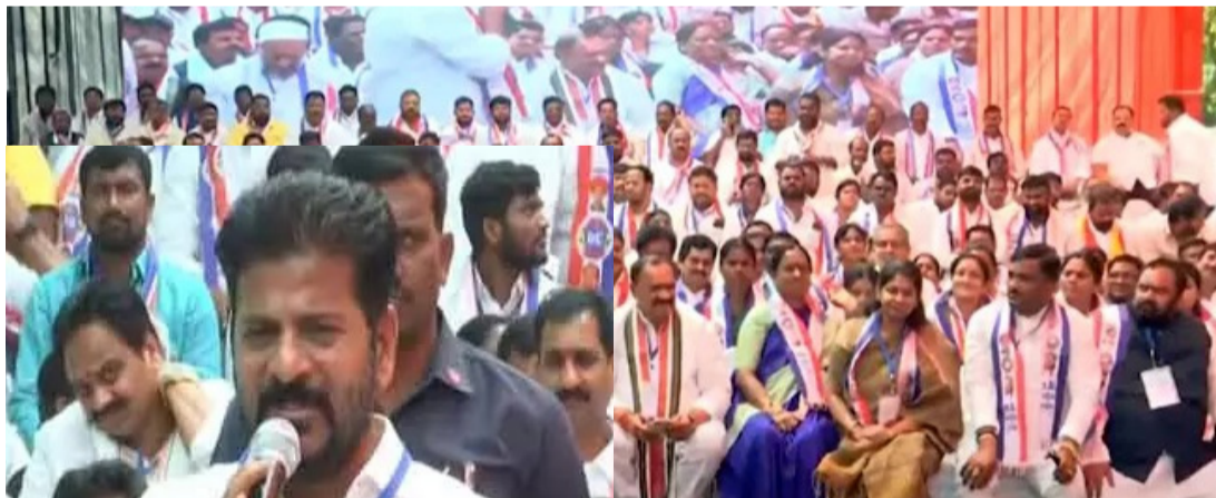
హైదరాబాద్ ఏప్రిల్ 02 (ప్రజాస్వరం):

కాంగ్రెస్ అధికారంలోకి వచ్చిన 100 రోజుల్లోనే దీనిపై తీర్మానం చేశాం: సీఎం