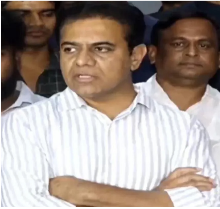
హైదరాబాద్ మార్చి 31 (ప్రజాస్వరం):

కానీ మీరు ఇప్పుడు వేలం పెట్టి ఎవరికి ఇవ్వాలి అనుకుంటున్నారు : కేటీఆర్