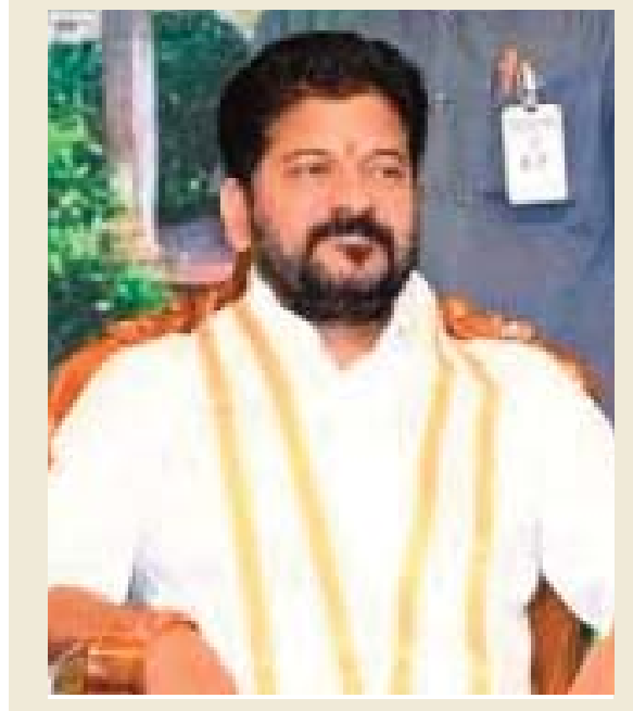
లక్షలాది మందికి ఉపాధి కల్పించేలా 'ఫ్యూచర్ సిటీ' సీఎం రేవంత్ రెడ్డి

హైదరాబాద్ : ప్రజా సంక్షేమం, రాష్ట్రభివృద్ధి కోసం నిరంతరం శ్రమిస్తున్న ముఖ్యమంత్రి తెలంగాణ సీఎం రేవంత్ రెడ్డి అన్నారు. ప్రపంచస్థాయిలో