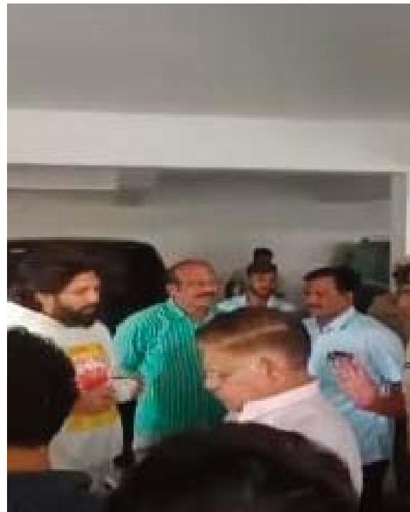
అల్లు ఇంటికి చేరుకున్న పోలీసులు