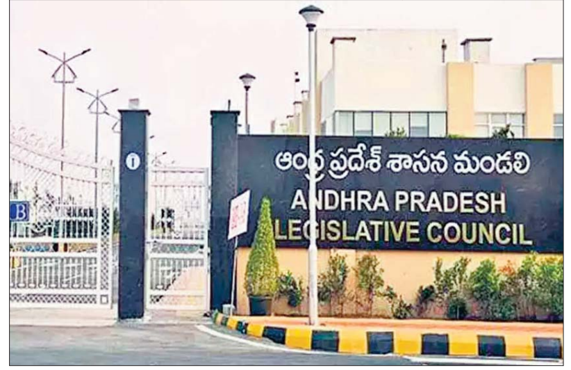
సీఎం చంద్రబాబు ఆర్థికశాఖపై రెండుమూడు విడతలుగా సమీక్షా సమావేశాలు నిర్వహించారు. గత ఆరు నెలలుగా ఓటాన్ బడ్జెట్ తోనే ప్రభుత్వం నడుస్తోంది. ఇలా ఉంటే రాష్ట్ర చరిత్రలో మొదటి సారి ఒకే ఏడాది రెండుసార్లు ఓటాన్ అకౌంట్ బడ్జెట్ ప్రవేశపెట్టారు. రాష్ట్ర ఆర్థిక పరిస్థితి దృష్ట్యా తప్పనిసరి పరిస్థితుల్లో ఓటాన్ అకౌంట్ బడ్జెట్ కు వెళ్తున్నట్లు ప్రభుత్వ వర్గాలు చెబుతున్నాయి.

ఆరోజు నుంచే సమావేశాలు 5 నెలలకు బడ్జెట్ ప్రవేశపెట్టేందుకు కనరత్తు అమరావతి, ప్రజాస్వరం: ఈ నెల 11 నుండి ఏపీ అసెంబ్లీ సమావేశాలు జరగనున్నాయి. ఈ నెలాఖరుతో ఓటాన్ బడ్జెట్ ముగియనున్న నేపథ్యంలో ప్రభుత్వం పూర్తిగా బడ్జెట్ ప్రవేశపెట్టనుంది. 11వ తేదీన పూర్తిగా బడ్జెట్ ను సభలో ప్రవేశపెట్టబోతున్నట్లు తెలుస్తోంది. అంతే కాకుండా పది రోజుల పాటు సమావేశాలు నిర్వహించి.. పలు బిల్లులను సభలో ప్రవేశపెట్టే యోచనలో ఏపీ సర్కార్ ఉన్నట్లు సమాచారం. ఉదయం 10 గంటలకు కేబినెట్ భేటీతో పాటు అదే రోజు బడ్జెట్ ప్రవేశపెట్టాలని ప్రభుత్వం భావిస్తుంది. మొత్తం 5 నెలలకు బడ్జెట్ ప్రవేశపెట్టేందుకు ప్రభుత్వం కనరత్తు చేస్తున్నట్లు సమాచారం అందుతోంది. సనంబర్, డిసెంబర్, జనవరి, ఫిబ్రవరి, మార్చి నెలలకు బడ్జెట్ ప్రవేశపెట్టనున్నాడు. ఇప్పటికే