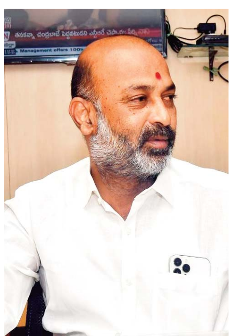
హైదరాబాద్ : రైతు భరోసా ఎప్పుడిస్తారు. రైతు కులీలకు రూ. 12500 ఎప్పుడిస్తారు. 500 రూపాయల బోనస్ ఎప్పుడు ఆకౌంట్ల వేస్తారని కేంద్రమంత్రి బండి సంజయ్ కుమార్

ఆ పార్టీ నేతల ప్రభుత్వాన్ని కూల్చుకుంటారు? తెలంగాణలో తిరగలేని పరిస్థితి ఎమ్మెల్యేలు, మంత్రులది కేంద్రమంత్రి బండి సంజయ్