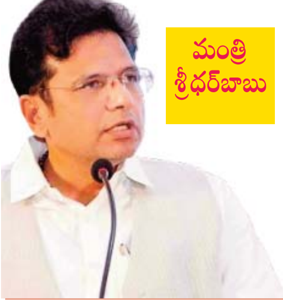
మంత్రి శ్రీధర్ బాబు