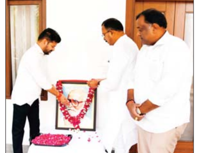
చుకొని ఢిల్లీలోని అధికారిక నివాసంలో కాళోజి గారి చిత్రపటానికి ముఖ్యమంత్రి పుష్పాంజలి ఘటించారు.

కాళోజికి సీఎం రేవంత్ నివాళి హైదరాబాద్: 'అన్యాయాన్ని ఎదిరిస్తే నా గొడవకు సంక్షేమం.. అన్యాయం అంతరిస్తే నా గొడవకు ముక్తిపాప్తి.. అన్యాయాన్ని ఎదిరించిన వాడి నాకు ఆరాధ్యుడని ప్రకటించిన ప్రజా కవి కాళోజి నారాయణరావు గారు నిత్య స్మరణీయులని ముఖ్యమంత్రి రేవంత్ రెడ్డి గారు కొనియాడారు. కాళోజి నారాయణరావు గారి వర్ణనలను పురస్కరిం