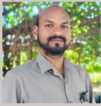
దౌలాబాద్, అక్టోబర్ 23 (ప్రజాస్వరం):

ఖరీఫ్ సీజన్ వడ్ల కొనుగోళ్ల కోసం మండల వ్యాప్తంగా జిల్లా గ్రామీణ అభివృద్ధి సంస్థ ఆధ్వర్యంలో ధాన్యం కొనుగోలు కేంద్రాలు గురువారం ప్రారంభించనున్నట్లు ఏపీఎం యాదగిరి తెలిపారు. జిల్లా కలెక్టర్ ఆదేశాల వరకు సూచించి, ముత్యంపేట, ముఖారాన్ పూర్, హైమవనగర్, మల్లెశంపల్లి, మహమ్మద్ షాపూర్, ఇందుప్రయోల్, చెట్ల నర్సంపల్లి, గోదావరిపల్లి, కొనాయిపల్లి, ఉప్పరపల్లి, గుప్పలేగి గ్రామాల్లో కొనుగోలు కేంద్రంలో ప్రారంభించనున్నట్లు ఆయన ఓ ప్రకటనలో తెలిపారు.