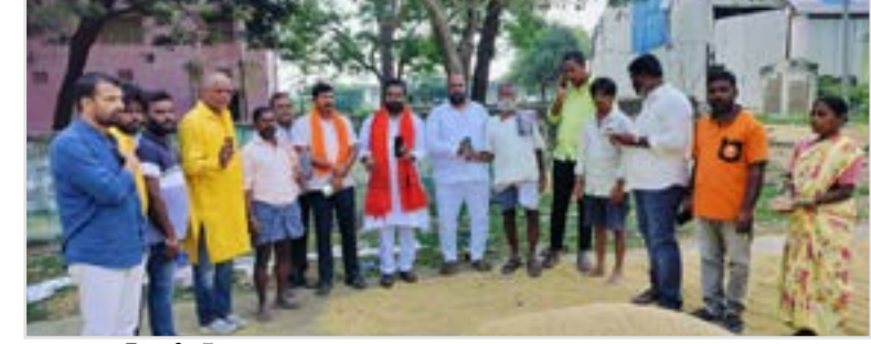
మెదక్, అక్టోబర్ 23 (ప్రజాస్వరం):