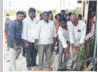
చిన్న శంకరంపేట, అక్టోబర్ 23 (ప్రజాస్వరం):