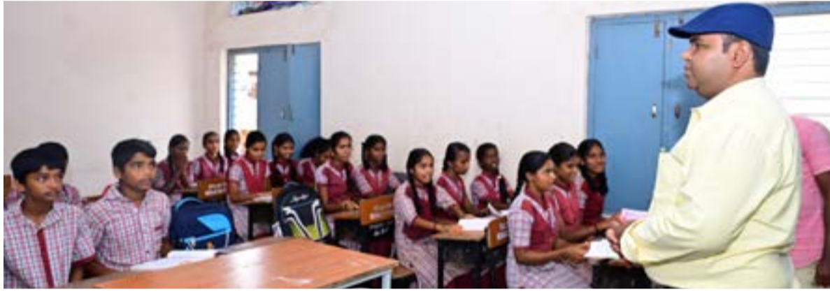
చిన్న శంకరంపేట, అక్టోబర్ 16 (ప్రజాస్వరం) :

జిల్లా పరిషత్ ప్రభుత్వ ఉన్నత పాఠశాలలో కలెక్టర్ ఆకస్మిక తనిఖీ