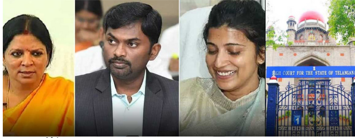
(మొదటి పేజీ తరువాయి)

డీవోపీటీ తెలుగు రాష్ట్రాల ఐపిఎస్ అధికారులను అదేశించిన విషయం తెలిసింది.