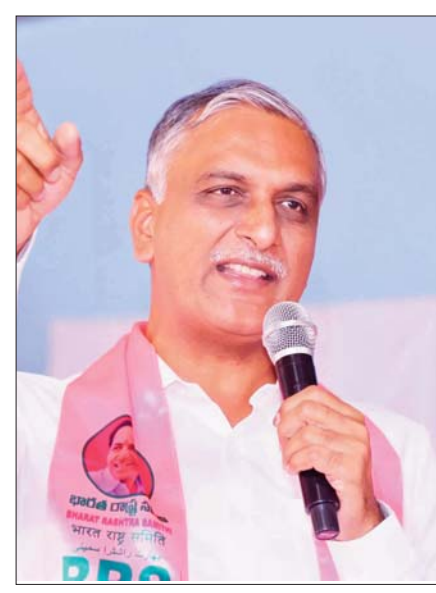
హైదరాబాద్, ప్రజాస్వరం : అధికారం లేకుంటే ఒక మాట, అధికారంలోకి వచ్చాక ఇంకో మాటనా అని హరీష్ రావు ప్రశ్నించారు. పోలీసుల పట్ల ఎందుకు ఇంత కఠినంగా వ్యవహరిస్తున్నారని, వారి ఆవేదన ఎందుకు అర్థం చేసుకోవడం లేదని నిలదీశారు. భేషజాలు పక్కన పెట్టి టీడీపీపై సిద్ధాంత సమస్యల పరిష్కారం చేయాలని 10 మందిని ఉద్యోగం నుంచి తొలగిస్తూ జారీ చేసిన ఉత్తర్వులను తక్షణం ఉపసంహరించుకోవాలని చెప్పారు. సస్పెండ్ చేసిన 39 మంది కానిస్టేబుల్లను కూడా వెంటనే విడుదల చేసి తీసుకోవాలని డిమాండ్ చేశారు.

కానిస్టేబుల్లను సర్వీసు నుంచి తొలగింపు అధికారం లేకుంటే ఒక మాట.. అధికారం వచ్చాక ఇంకో మాట 10 మందిని ఉద్యోగం నుంచి తొలగిస్తూ ఇచ్చిన ఉత్తర్వులను ఉపసంహరించుకోవాలి : మాజీ మంత్రి హరీష్ రావు