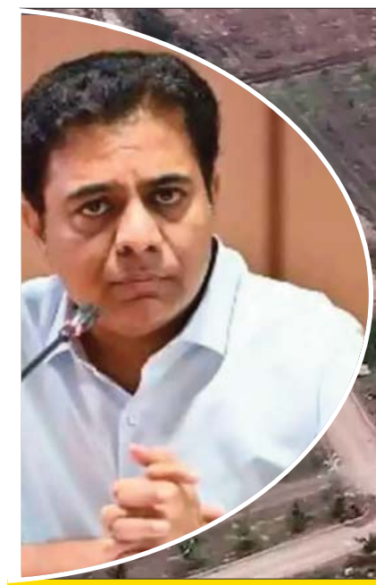
రాజ్ పాకాల ఫామ్ హౌస్ పై అర్ధరాత్రి