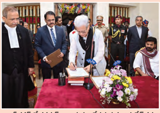
రాజ్ భవన్ లో గవర్నర్ గా బాధ్యతలు చేపడుతున్న జిష్ణు దేవ్ వర్మ

హైదరాబాద్, జూలై 31, ప్రజాస్వరం : తెలంగాణ నూతన గవర్నర్ జిష్ణు దేవ్ వర్మ బుధవారం హైదరాబాద్ చేరుకున్నారు. ఆయనకు శంషాబాద్ విమానాశ్రయంలో ముఖ్యమంత్రి రేవంత్ రెడ్డి ఘనంగా స్వాగతం పలికారు. సాయంత్రం రాష్ట్ర హైకోర్టు ప్రధాన న్యాయమూర్తి జస్టిస్ అలోక్ ఆరాధే రాజ్ భవన్ లో జిష్ణు దేవ్ వర్మ చేత పదవీ స్వీకార ప్రమాణం చేయించారు. కార్యక్రమంలో సీఎం రేవంత్ రెడ్డి, కేంద్ర మంత్రి కె.కె.ఎస్. రెడ్డి, డిప్యూటీ సీఎం భట్టి విక్రమార్కు, శాసనమండలి చైర్మన్ గుత్తా సుబేందర్ రెడ్డి, అసెంబ్లీ స్పీకర్ ప్రసాద్ కుమార్, ఎమ్మెల్యేలు, ఎమ్మెల్యేలు, అధికారులు పాల్గొన్నారు.