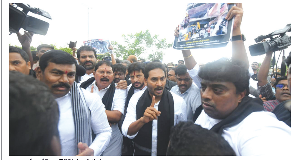
అమరావతి, జూలై 22 (ప్రజాస్వరం):

జగన్ ను అడ్డుకున్న పోలీసులు పోలీసులపై వేరికల్లీ చూపుతూ జగన్ ఆగ్రహం