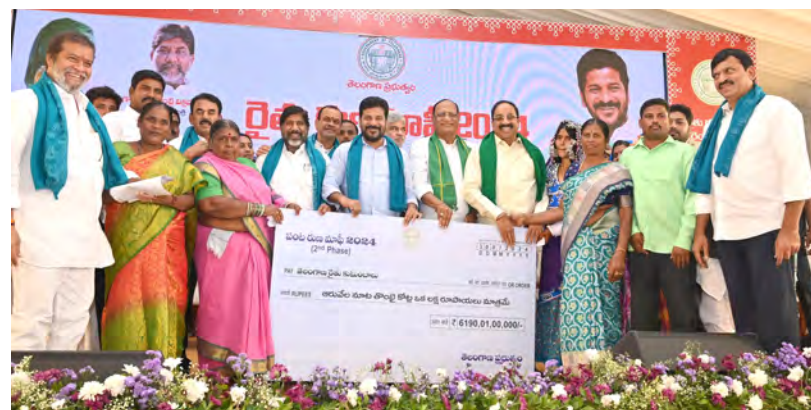
రుణమాఫీ చెక్కును మహిళా రైతులకు అందజేస్తున్న సీఎం రేవంత్, డిప్యూటీ సీఎం, మంత్రులు

రుణమాఫీ.. మా చిత్తశుద్ధి, నిబద్ధతకు నిదర్శనం