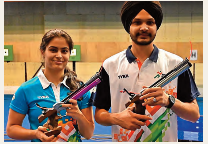
వహించాడు. ప్రివర్ట్ తర్వాత ఒకే ఒలింపిక్స్ లో ఇప్పటి వరకు రెండు పతకాలను ఏ భారత అథ్లెట్ ఈ ఫీట్ సాధించలేదు. కాగా, తాజా ఒలింపిక్స్ లో రెండు పతకాలు సాధించి మను బాకర్ సరికొత్త చరిత్ర లిఖించారు.

న్యూఢిల్లీ, జూలై 30 (ప్రజాస్వరం): ఒలింపిక్స్ లో భారత్ రెండో పతకం గెలుచుకుని సత్తా చాటింది. 10 మీటర్ల ఎయిర్ పిస్టల్ మిక్స్ డ్ డిమ్ ఈవెంట్లో కాంస్యం గెలుచుకుంది. మను బాకర్, సరబ్జోత్ జోతి కాంస్య పతకాన్ని సాధించి భారత్ కు రెండో పతకాన్ని అందించారు. కొరియా జంటపై 16-10 తేడాతో భారత జోడీ గెలుపొందింది. ఒకే ఒలింపిక్స్ లో 2 పతకాలు సాధించి మను బాకర్ రికార్డు సౌతం చేసుకున్నారు. అయితే భారత్ కు వ్యక్తిగత విభాగం 10 మీటర్ల ఎయిర్ పిస్టల్ లో కాంస్య పతకాన్ని మను బాకర్ సాధించారు. ఇండియా ట్రీటివ్ పాలసీలో ఉన్నప్పుడు 1900లో ఒలింపిక్స్ అథ్లెటిక్స్ లో నార్మన్ ప్రివర్ట్ ఒకేసారి రెండు పతకాలు సాధించాడు. ఇండియా తరఫున ప్రివర్ట్ ప్రాతినిధ్యం