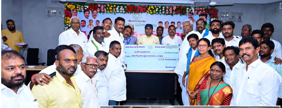
మెదక్, జూలై 30 (ప్రజా స్వరం) :

తెలంగాణ రాష్ట్ర ప్రభుత్వం ప్రతిష్టాత్మకంగా ప్రవేశ పెట్టిన రుణమాఫీ 2024లో భాగంగా రెండు లక్షల రోపుల రుణాల కలిగిన రైతుల ఖాతాల్లో రుణమాఫీ నిధులు విడుదల చేసినట్లు జిల్లా కలెక్టర్ రాహుల్ రాజ్ తెలిపారు. మంగళవారం మెదక్ జిల్లా కలెక్టర్ రేట్ కార్యాలయంలో రుణమాఫీ రెండో విడతలో భాగంగా లక్ష రూపాయల వరకు రుణం కలిగిన రైతులకు నిధుల విడుదల కార్యక్రమం సీఎం రేపం తోటి ప్రారంభించారు. ఇందులో భాగంగా ఈ కార్యక్రమంలో సమీకృత కలెక్టర్ భవన సమూహం డి.వి.ఎం. హోల్ నందు రైతులతో సమావేశం నిర్వహించారు. ఈ కార్యక్రమంలో ముఖ్యఅధికారి కలెక్టర్ రాహుల్ రాజ్ పాల్గొని ప్రసంగించారు. ప్రభుత్వం రైతును రాజు చేయాలనే ఉద్దేశంతో రైతుకు సరైన సమయంలో రుణమాఫీ చేయడం ద్వారా తన పెట్టుబడి అర్హులకు, ఎరువులు పురుగు మందుల అవసరాలకు రుణమాఫీ నిధులు పనికి వస్తాయన్నారు.