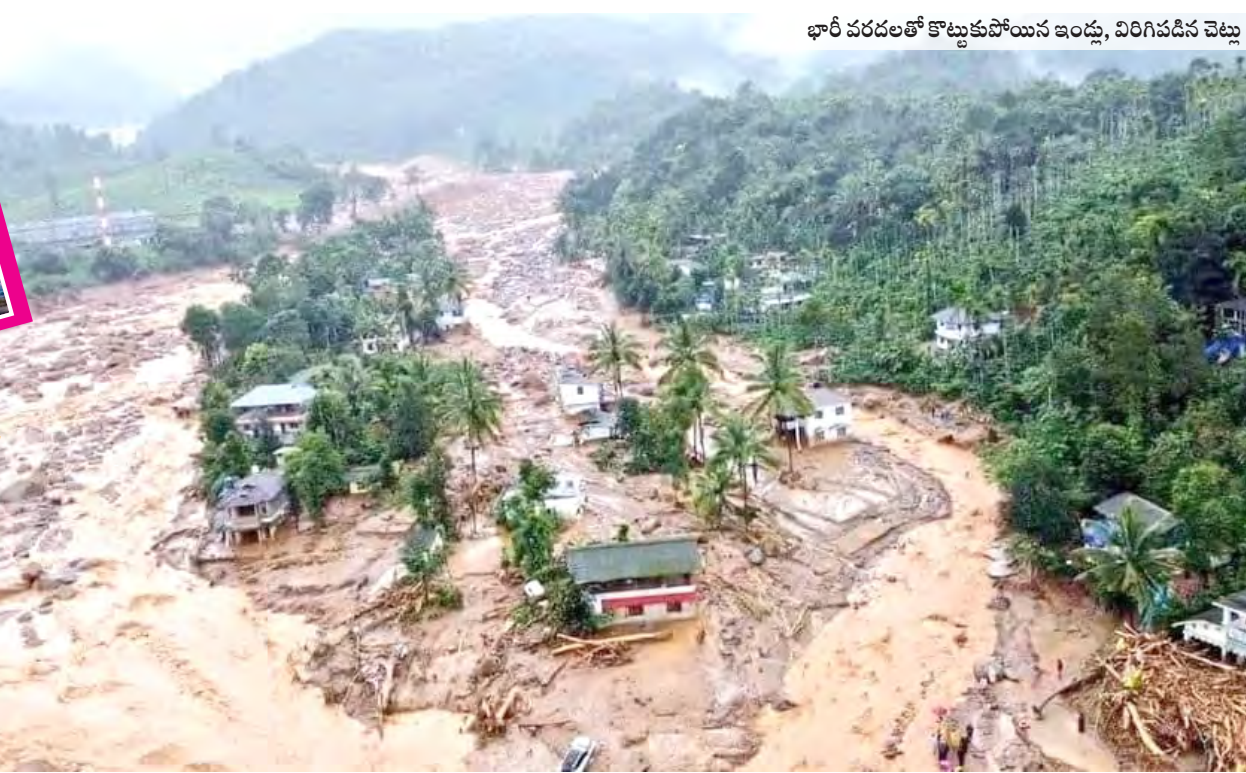
భారీ వరదలతో కొట్టుకుపోయిన ఇండ్లు, విరిగిపడిన చెట్లు