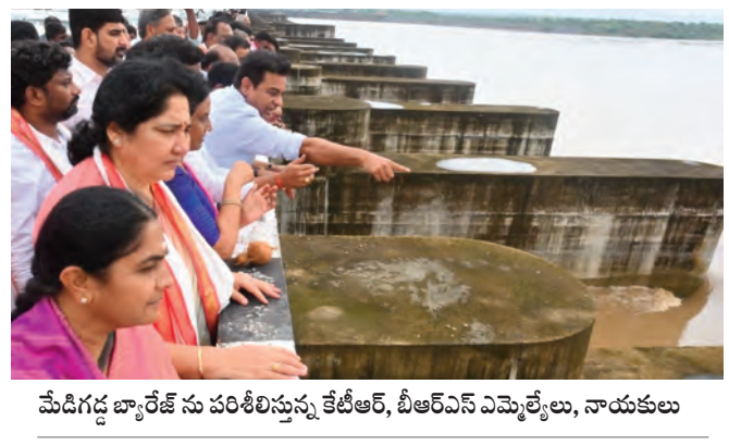
మేడిగడ్డ బ్యారేజ్ ను పరిశీలిస్తున్న కేటీఆర్, బీఆర్ఎస్ ఎమ్మెల్యేలు, నాయకులు

కాళేశ్వరం ప్రాజెక్టు తెలంగాణకు కల్పితరువు వెంటనే నీటిని లిఫ్ట్ చేయాలి అసెంబ్లీ సమావేశాలు ముగిసేలోగా ప్రభుత్వం నిర్ణయం తీసుకోవాలి మాజీ మంత్రి, బీఆర్ఎస్ పర్సన్ ప్రిసిడెంట్ కేటీఆర్