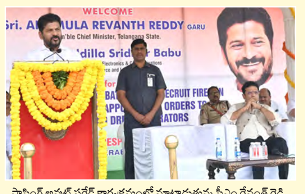
పాసింగ్ అవుట్ పరేడ్ కార్యక్రమంలో చుట్టూడుతున్న సీఎం రేవంత్ రెడ్డి

యూనివర్సిటీ రంగానికి జిల్లాలోనే ఏర్పాటు చేయనుండడంతో జిల్లా రింగ్ రోడ్డు సమీపంలో మరన్ని ప్రాజెక్టులకు అవకాశం లభించింది. జిబ్బర్ రింగ్ రోడ్డు నిర్మాణం హైదరాబాద్ కి మణిహారం. జిబ్బర్ రింగ్ రోడ్డు చుట్టూ పలు ప్రాంతాలను అనుసంధానం చేయడంతో హైదరాబాద్ నగరాభివృద్ధి మరింత వేగవంతమైంది. ఇలాంటి ఫలితాలను రాష్ట్రంలో మరిన్ని ప్రాంతాలకు విస్తరించేందుకు రీజినల్ మిగతా2లో..