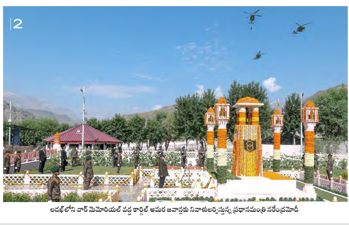
లడఖ్ లోని వార్ మెమోరియల్ వద్ద కార్గిల్ అమర జవాన్లకు నివాళులర్పిస్తున్న ప్రధానమంత్రి నరేంద్రమోదీ

ఉగ్రవాదాన్ని ఉపేక్షించం పాకిస్థాన్ దుష్ట ప్రణాళికలు ఎప్పటికీ ఫలించవు దేశం కోసం చేసిన ప్రాణత్యాగాలు అజరామరం 370ని రద్దు చేసి ఆగస్టు 5 నాటికి ఐదేళ్లు పూర్తి జమ్మా కశ్మీర్ కొత్త భవిష్యత్తుపై కలలు కంటోంది ప్రధానమంత్రి నరేంద్రమోదీ కార్గిల్ విజయ్ దినవల్లీ అమరవీరులకు నివాళి దేశవ్యాప్తంగా స్వలింగుకున్న ప్రజలు