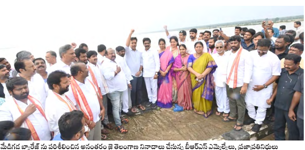
మేడిగడ్డ జ్యూరీజ్ సు పరిశీలించిన అనంతరం జై తెలంగాణ నివాదాలు చేస్తున్న బీఆర్ఎస్ ఎమ్మెల్యేలు, ప్రజాప్రతినిధులు

కాశీశ్వరం ప్రాజెక్టు తెలంగాణకు కల్పితరువు కరువును తరిమికొట్టేందుకే నిర్మించాం చిన్న సమస్యను కాంగ్రెస్ భూతర్షణలో చూపిస్తున్నది నీటిని వెంటనే లిఫ్ట్ చేయాలి అసెంబ్లీ సమావేశాలు ముగిసేలోగా నిర్ణయం తీసుకోవాలి ప్రభుత్వానికి మాజీ మంత్రి, బీఆర్ఎస్ వర్కింగ్ ప్రెసిడెంట్ కేటీఆర్ డెడ్ లైన్