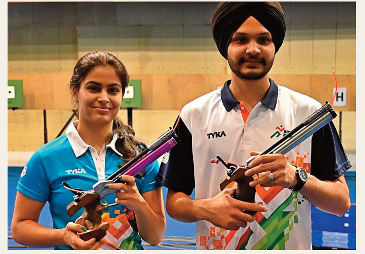
వహించాడు. ప్రివర్ట్ తర్వాత ఒకే ఒలింపిక్స్ లో ఇప్పటి వరకు రెండు పతకాలను ఏ భారత ఆథ్లెట్ ఈ ఫీట్ సాధించలేదు. కాగా, తాజా ఒలింపిక్స్ లో రెండు పతకాలు సాధించి మను బాకర్ సరికొత్త చరిత్ర లిఖించారు.

న్యూఢిల్లీ, జూలై 30 (ప్రజాస్వరం): ఒలింపిక్స్ లో భారత్ రెండో పతకం గెలుచుకుని సత్యా చాటింది. 10 మీటర్ల ఎయిర్ పిస్టల్ మిక్స్ డ్ టీమ్ ఈవెంట్లో కాంస్యం గెలుచుకుంది. మను బాకర్, సరబ్జోత్ జోతి కాంస్య పతకాన్ని సాధించి భారత్ కు రెండో పతకాన్ని అందించారు. కొరియా జంటపై 16-10 తేడాతో భారత జోడీ గెలుపొందింది. ఒకే ఒలింపిక్స్ లో 2 పతకాలు సాధించి మను బాకర్ రికార్డు సౌతం చేసుకున్నారు. అయితే భారత్ కు వ్యక్తిగత విభాగం 10 మీటర్ల ఎయిర్ పిస్టల్ లో కాంస్య పతకాన్ని మను బాకర్ సాధించారు. ఇండియా టీటీవ్ పాలసీలో ఉన్నప్పుడు 1900లో ఒలింపిక్స్ అథ్లెటిక్స్ లో నార్మన్ ప్రివర్ట్ ఒకేసారి రెండు పతకాలు సాధించాడు. ఇండియా తరఫున ప్రివర్ట్ ప్రాతినిధ్యం