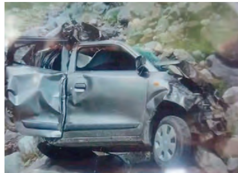
లోయలో పడడంతో నుజ్జునుజ్జిన కారు