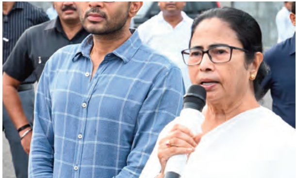
నీతి ఆయోగ్ సమావేశం నుంచి వాకౌట్ చేసే అసంతరం విలేకరులతో మాట్లాడుతున్న బెంగాల్ సీఎం మమతా బెనర్జీ

బెంగాల్ సీఎం మమతా బెనర్జీ వాకౌట్ గైర్నా జరైన ఎన్టీపి ప్రతిపక్షపాలిత ముఖ్యమంత్రులు బీహార్ సీఎం నితీశ్ కుమార్ సైతం డుమ్మా బడ్జెట్ కేటాయింపుల్లో వివక్షపై 'ఇండియా' పార్టీల బహిష్కరణ