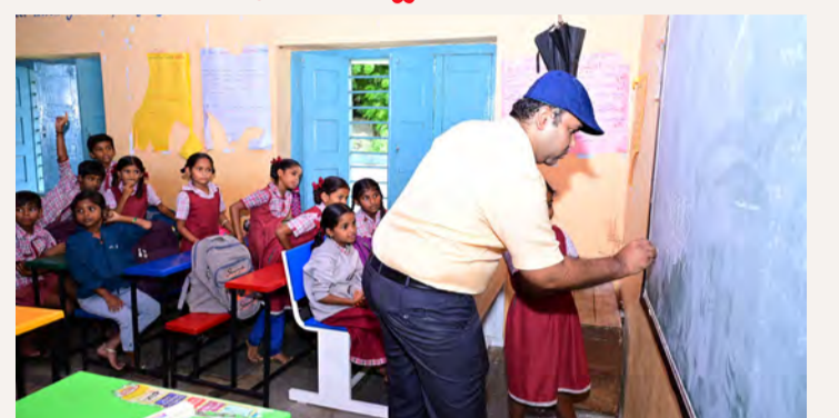
మెదక్, జూలై 27 (ప్రజా స్వరం) :