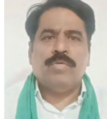
చట్టాలు తీసుకొచ్చి రైతులను ఇబ్బందులకు గురిచేయాలని చూస్తుందన్నారు. కానీ మోడీ అటలు ఇక చెల్లవన్నారు.