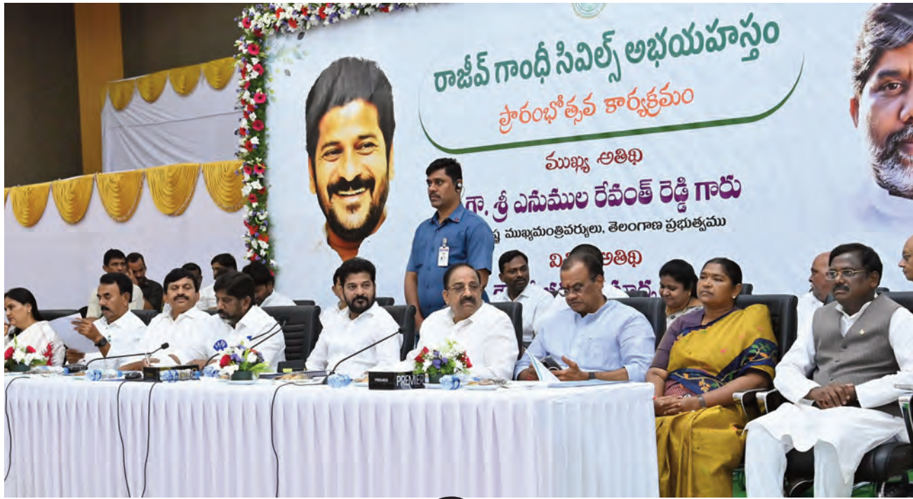
కార్యక్రమంలో మాట్లాడుతున్న సీఎం రేవంత్ రెడ్డి, పాల్గొన్న మంత్రులు