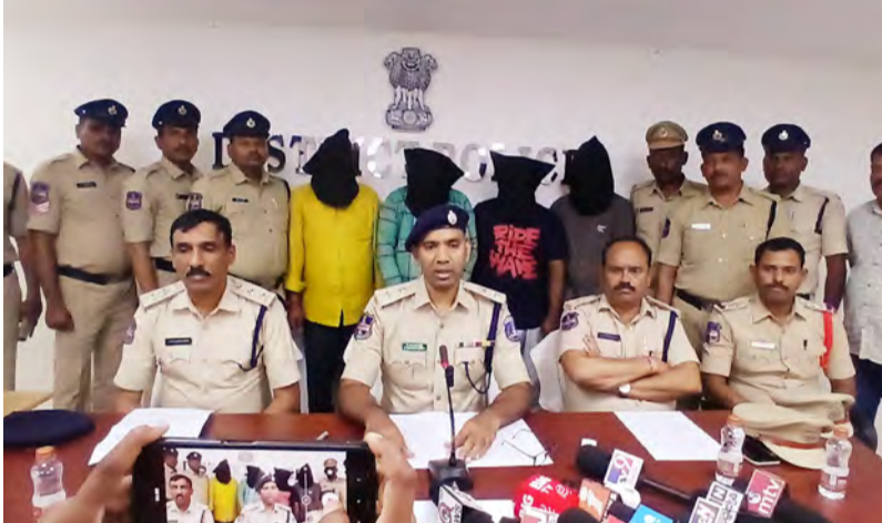
వికారాబాద్, జూలై 20 (ప్రజా స్వరం):

స్వాధీనం చేసుకున్న వాటి వివరాలు.. 1. 1590 నకిలీ 500 రూపాయల నోట్లు విలువ Rs 7,95,000/- 2. కంప్యూటర్, ఫైబర్, పేపర్, లిబ్రరీ 3. మొదటి ఫోన్లు నకిలీ నోట్ల చలామణి పై చట్టరీత్యా కఠినమైన చర్యలు ఉంటాయి అని జిల్లా ఎస్పీ తెలిపారు. దొంగ నోట్లకు సంబంధించి ఎలాంటి సమాచారం ఉన్నా పోలీసులకు సమాచారం ఇచ్చి సహకరించాలి అని ఎస్పీ తెలిపారు.