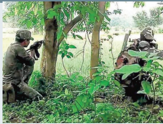
వలువురు మావోయిస్టులు మృతి

హైదరాబాద్, జూలై 19 (ప్రజాస్వరం) : తెలంగాణ-చత్తీస్ గడ్ సరిహద్దుల్లో మరోసారి ఎదురు కాల్పులు కలకలం రేపాయి. భద్రతా బలగాలు, మావోయిస్టుల మధ్య కాల్పులు కొనసాగుతున్నాయి. ఎదురుకాల్పుల్లో కొందరు మావోయిస్టులు మృతి చెందినట్లు తెలుస్తోంది. భారీగా ఆయుధ సామగ్రిని భద్రతా బలగాలు స్వాధీనం చేసుకున్నట్లు తెలిసింది. ఈ ఘటనకు సంబంధించి పూర్తి వివరాలు తెలియాల్సి ఉంది.