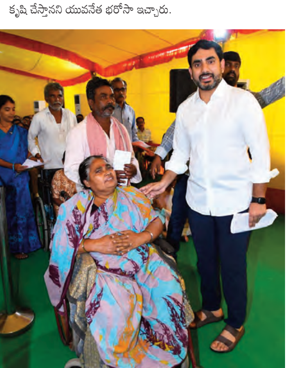
కృషి చేస్తానని యువనేత భరోసా ఇచ్చారు.