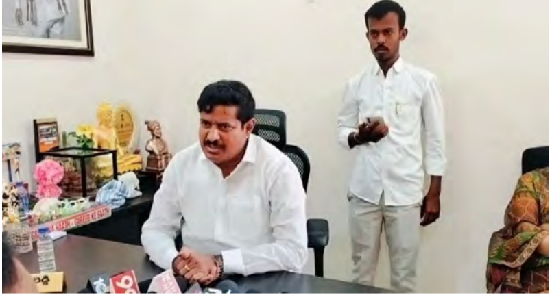
తాండూరు, జూలై 01(ప్రజా స్వరం) :