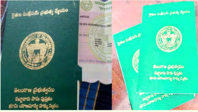
మహబూబ్ నగర్, జూన్ 29 (ప్రజాస్వరం) :