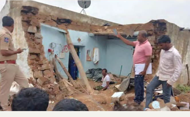
మహబూబ్ నగర్, జూలై 1, (ప్రజాస్వరం)