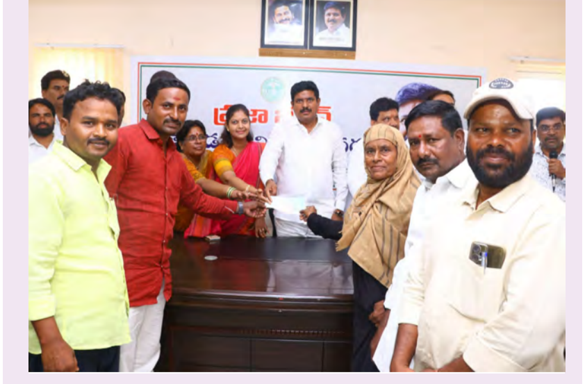
తాండూరు, జూలై 1 (ప్రజాస్వరం) :