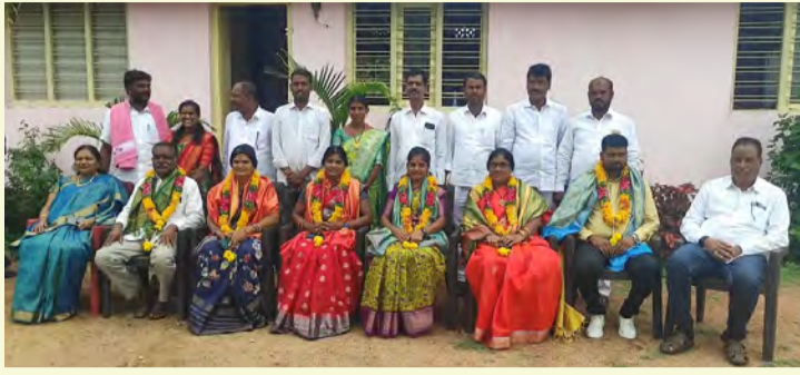
రామాయంపేట, జూలై 1 (ప్రజాస్వరం) :