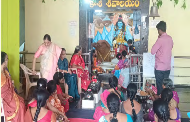
మెదక్, జూలై 01 (ప్రజా స్వరం) :