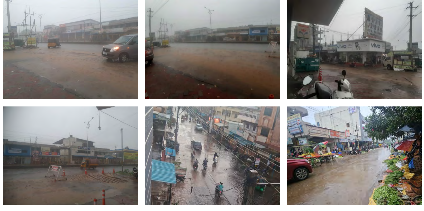
వికారాబాద్, జూన్ 30 (ప్రజాస్వరం) :

వికారాబాద్ జిల్లాలో ఆదివారం సాయంత్రం భారీ వర్షం కురిసింది. దీంతో లోతట్టు ప్రాంతాలన్నీ జలమయమైనాయి. వికారాబాద్ జిల్లా వ్యాప్తంగా సగటున 30 నుంచి 40 మిల్లీమీటర్ల వర్షపాతం నమోదవడం గమనార్హం. జిల్లాలోని కొన్ని చోట్ల 60 మిల్లీమీటర్ల వరకు వర్షపాతం కూడా నమోదయింది. జిల్లాలోని పెద్దేముల్, బంటారాం, మర్చల్ మండలాల్లో జిల్లాలోని మిగతా ప్రాంతాల కన్నా అధిక వర్షపాతం నమోదయింది. భారీ వర్షం కురవడంతో రైతులు ఆనందోత్సవాలు వ్యక్తం చేశారు. జిల్లాలో సాగులో ఉన్న పత్తి, కంది, పెసర, మినుము వంటి పంటలకు కురిసిన భారీ వర్షం వల్ల మేలు కలిగినట్లు ఆయందని రైతులు సంతోషం వ్యక్తం చేశారు. జిల్లాలో వర్షాధారంగా 170 నుంచి 180 రోజుల పంట కాలం ఉండే కంది, పత్తి వంటి పంటలు