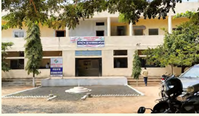
వికారాబాద్, జూన్ 30 (ప్రజాస్వరం) :