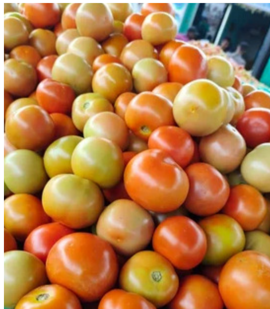
సీజన్ లో కొంత కరువు ఛాయలు కనిపించాయి. నీటి పంపిణీ లేక చాలా ప్రాంతాల్లో కూరగాయల సాగు తగ్గింది. వీటి ప్రభావంతో కూడా ప్రస్తుతం మార్కెట్ లో