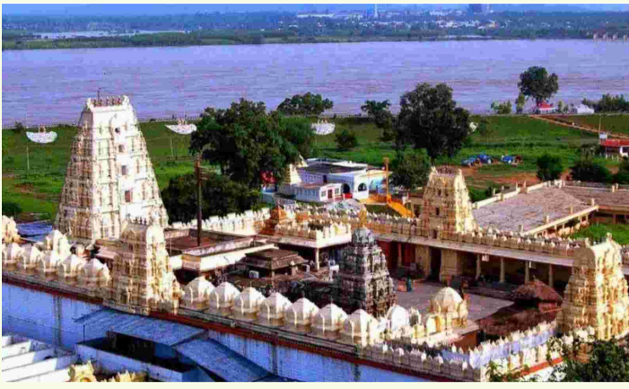
ఖమ్మం, జూన్ 21 (ప్రజాస్వరం) :