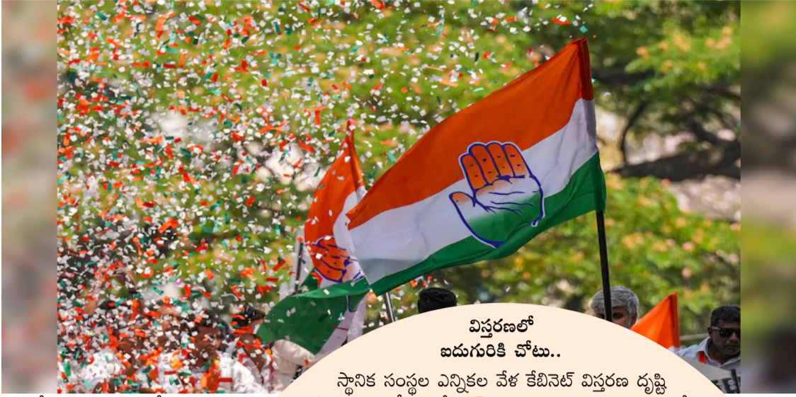
విస్తరణలో ఐదుగురికి చోటు..