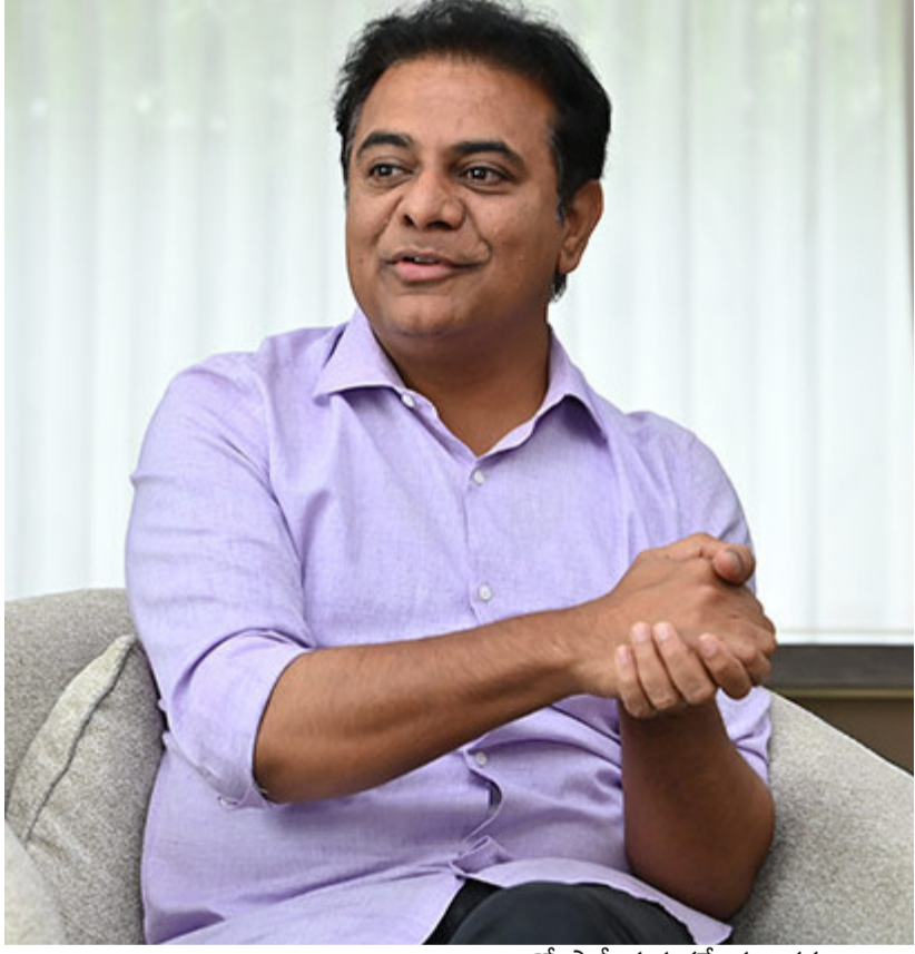
హైదరాబాద్, జూన్ 21 (ప్రజాస్వరం) :

బీఆర్ఎస్ వర్కింగ్ ప్రెసిడెంట్ కేటీఆర్ పూర్వచర్ డైలామాలో పడింది. ఆసెంబ్లీ ఎన్నికలు, లోక్ సభ ఎన్నికల్లో అన్నీ తానై వ్యవహరించిన గులాబీపార్టీ చిన్నబాస్ లోక్ సభ ఫలితాల తర్వాత పత్తా లేకుండా పోయారు. అసలే సీఎం సీటు దిగాల్సి వచ్చిందన్న బెంగతో కేటీఆర్ ఫ్యాన్ ఫ్యాన్ నుంచి బయటకు రావడం లేదు. ఇటు చూస్తే ఒక్క ఎంపీ స్థానం కూడా దక్కకపోవడంతో కేటీఆర్ పార్టీ శ్రేణులకు నల్లపాన అయిపోయారు. తీవ్రం జైలుకు వెళ్లి చెల్లిన చూసాల్సిన వెంటనే ఆయనకు ఎన్నికల అభివృద్ధి ఉచ్చు బిగించుకుంది. ఆ క్రమంలో ఆయన పోస్టుపై పార్టీలో పెద్ద చర్చ జరుగుతుంది. వరుస ఓటములతో బీఆర్ఎస్ ఉక్కిరి బిక్కిరి అవుతుంది. మరోవైపు వలసలు గులాబీ పెద్దలకు షాక్ లు ఇస్తున్నాయి.