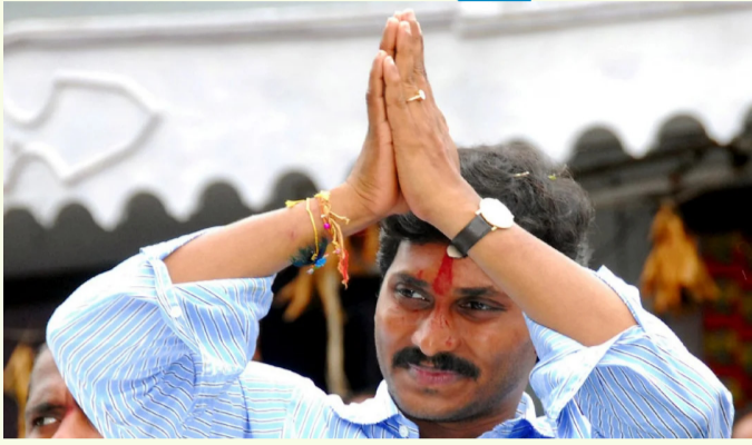
విజయవాడ, జూన్ 21 (ప్రజాస్వరం) :