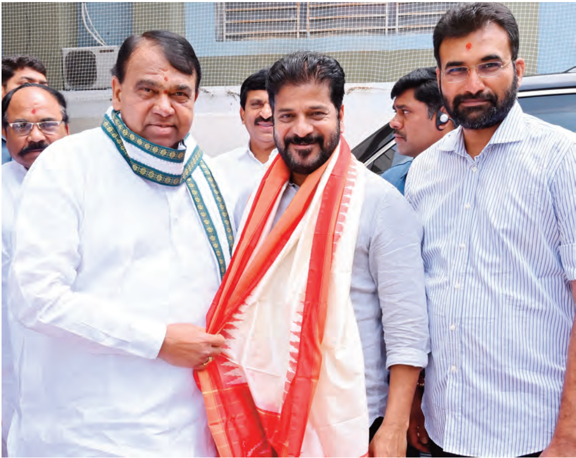
ముఖ్యమంత్రి రేవంత్ రెడ్డిని శాలువా కప్పి సన్మానిస్తున్న పోచారం శ్రీనివాస్ రెడ్డి