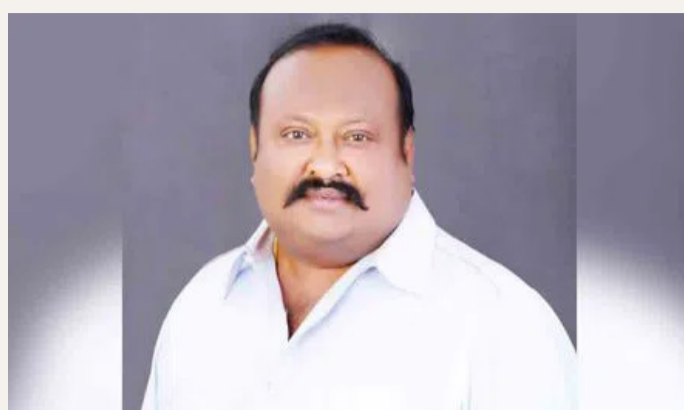
కరీంనగర్, జూన్ 21 (ప్రజాస్వరం) :