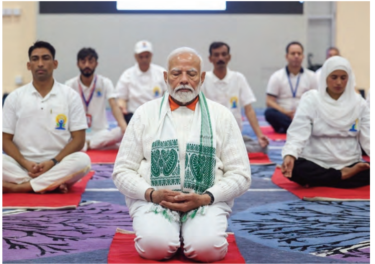
జమ్మూ కశ్మీర్ లో అంతర్జాతీయ యోగా దినోత్సవంలో పాల్గొని అనసం చేస్తున్న ప్రధానమంత్రి నరేంద్రమోదీ