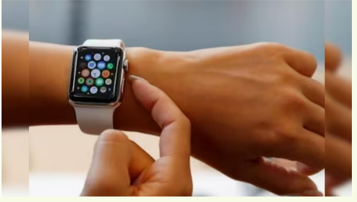
కరీంనగర్, జూన్ 21 (ప్రజాస్వరం) :