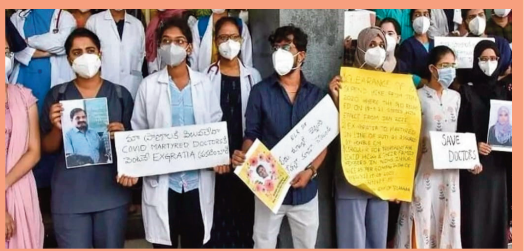
రేపటి నుంచి జూనియర్ డాక్టర్ల సమ్మె హైదరాబాద్, జూన్ 23 (ప్రజాస్వరం): హైదరాబాద్, జూన్ 23 (ప్రజాస్వరం): రేపటి నుంచి డ్యూటీలకు హాజరు కాబోమని రాష్ట్ర వ్యాప్తంగా జూనియర్ డాక్టర్లు ప్రకటించారు. తమ సమస్యలను తక్షణమే పరిష్కరించాలని ప్రభుత్వాన్ని డిమాండ్ చేస్తూ జూనియర్ డాక్టర్లు రేపటి నుంచి సమ్మెకు దిగనున్నారు. అత్యవసర సేవలు మినహా అన్ని సేవలను నిలిపివేస్తామని ప్రకటించారు.